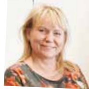
fol. Urząd Marszałkowski

W przeszłości pracował m.in. jako główny specjalista ds. sprzedaży w Banku Pocztowym, był dyrektorem ds. sprzedaży w Zachodniopomorskim Regionalnym Funduszu Poręczeń Kredytowych, prokurentem w Funduszu Pomerania.