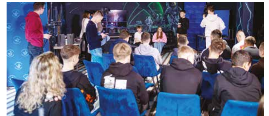
Warsztaty „Autoprezentacja przed kamerą” prowadzone przez Uniwizję

W ramach projektu planowane są kolejne edycje oraz rozwój formuły obozu jako narzędzia promocji zawodów przyszłości i kształcenia dopasowanego do potrzeb gospodarki. Zawodowy Summer Camp jest również elementem szerokiej kampanii społecznej promującej samokształcenie, dzielenie się doświadczeniem zawodowym oraz budowanie kultury edukacji trwającej przez całe życie.