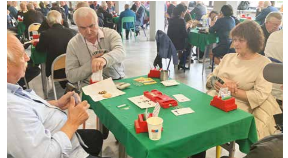
W zawodach wzięło udział ponad 150 zawodników z całej Polski.