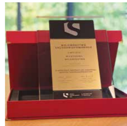
Statuetka Innowacyjny Samorząd

W dotychczasowych dwóch edycjach w 2024 i w 2025 roku udział wzięło łącznie niemal 800 uczniów szkół branżowych, techników i liceów z całego regionu. Uczestnicy wyłonieni są w ramach konkursu „Kręci mnie to”, w którym młodzież tworzy krótkie filmy prezentujące ich zawodowe marzenia i pasje. Zwycięskie zespoły otrzymują zaproszenie na czterodniowy obóz edukacyjno-zawodowy „Zawodowy Summer Camp”, gdzie czekają na nich inspirowane