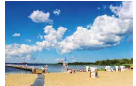
Kąpielisko w Stepnicy z Certyfikatem Błękitnej Flagi

Już wkrótce ruszy w Stepnicy budowa Parku Flory i Fauny Zalewu Szczecińskiego w re-