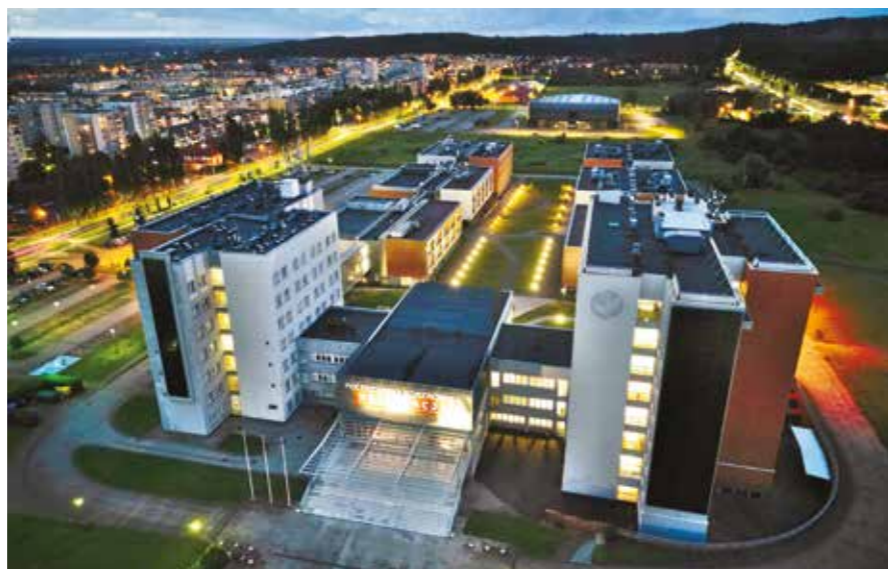
Nowe kierunki znajdują się w ofercie uczelni już w roku akademickim 2025/2026. | fot. ADAM PACZKOWSKI / PK

PK chce kształcić inżynierów z zastosowań sztucznej inteligencji w przemyśle. | fot. ADAM PACZKOWSKI / PK