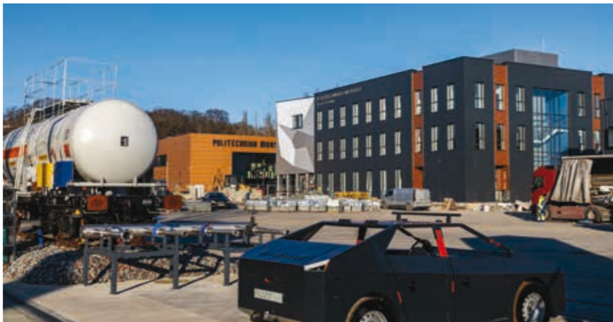
Polski Ośrodek Szkoleniowy Ratownictwa Morskiego ma na celu stworzenie europejskiego standardu szkolenia praktycznego dla sektora morskiego i żeglugi śródlądowej.

Politechnika Morska w Szczecinie, publiczna uczelnia techniczna z prawie 80-letnią tradycją, łączy dziś klasyczne kształcenie morskie z nowoczesnymi metodami dydaktycznymi i praktycznymi efektami kształcenia. Uczelnia aktualnie kształci studentów na sześciu wydziałach, co daje szerokie spektrum kompetencji od technologii morskich, prężnie rozwijającej się branży offshore, przez systemy IT, po logistykę i zarządzanie.