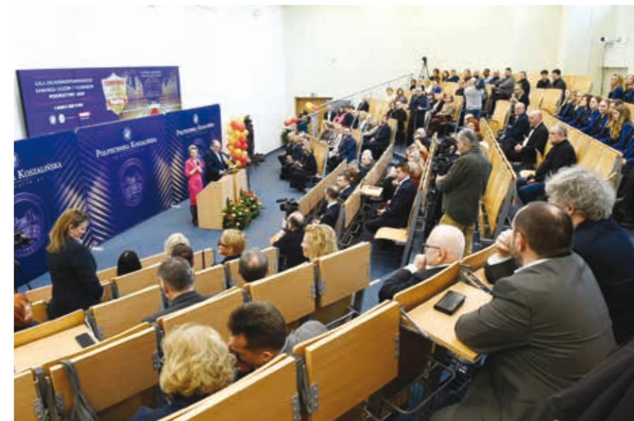
Gala Perspektyw na Politechnice Koszalińskiej.

Marzec każdego roku jest na Politechnice Koszalińskiej miesiącem wyjątkowej aktywności całego środowiska akademickiego, począwszy od studentek i studentów, a kończąc na organizatorach wydarzeń. Marzec tego roku przyniósł między innymi drugą edycję gali Zachodniopomorskiego Rankingu Liceów i Techników Perspektywy i odstąpienie rzeźby „Profesora” – skrzata Julka Jamneńskiego. Szlak Julków ma być nową atrakcją turystyczną Koszalina i regionu.