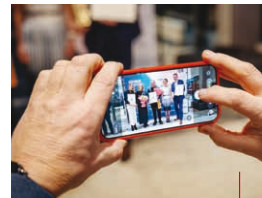
Tuż po ceremonii w ruch poszły prywatne smartfony.