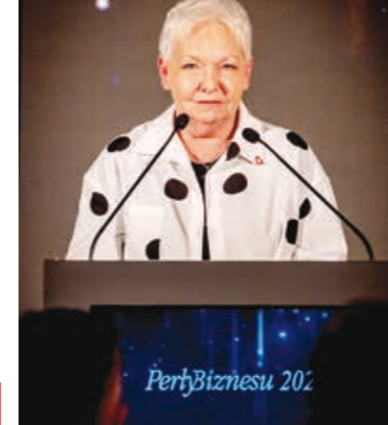
Gratulując laureatom Magdalena Kochan, senator RP, mówiła o różnorodności w sukcesach biznesowych Pomorza Zachodniego.