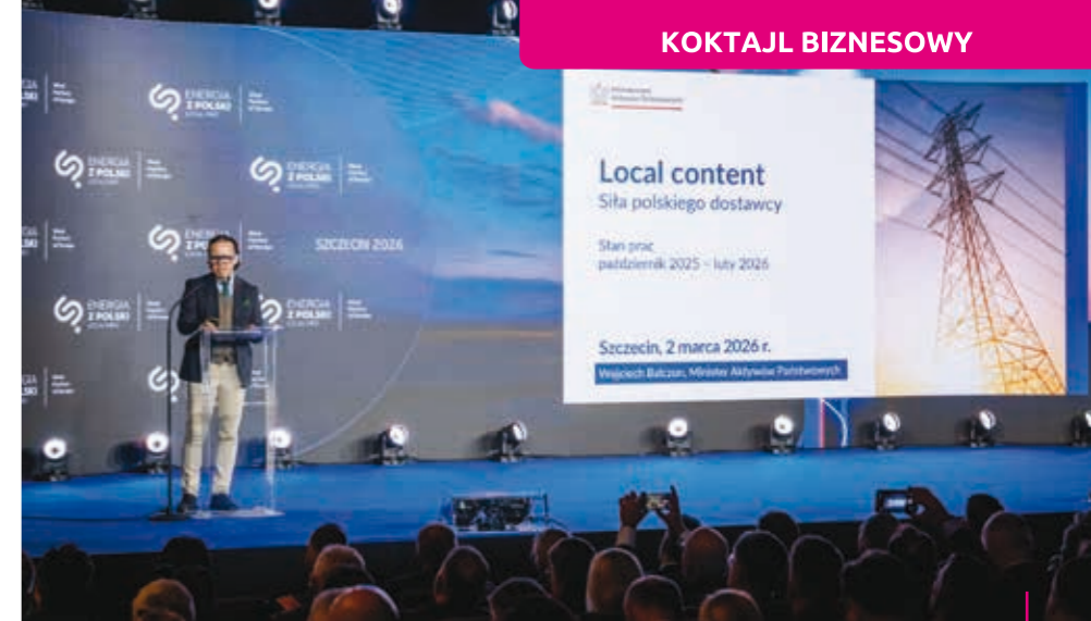
Wojciech Batczun: – To, co dzieje się dziś, to efekt świadomych decyzji o wspieraniu polskich firm.

– Polska energetyka wiatrowa, energetyka jądrowa, sektor paliwowy oraz sektor zbrojeniowy to obszary, w których będziemy przeznaczać ogromne środki na inwestycje, wzmacniając bezpieczeństwo państwa, bezpieczeństwo energetyczne oraz bezpieczeństwo w najszerzym tego słowa znaczeniu – mówił gość forum Wojciech Batczun , minister aktywów państwowych.