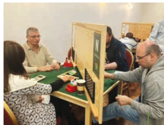
W finale Grand Prix wzięło udział 26 najlepszych par regionu.