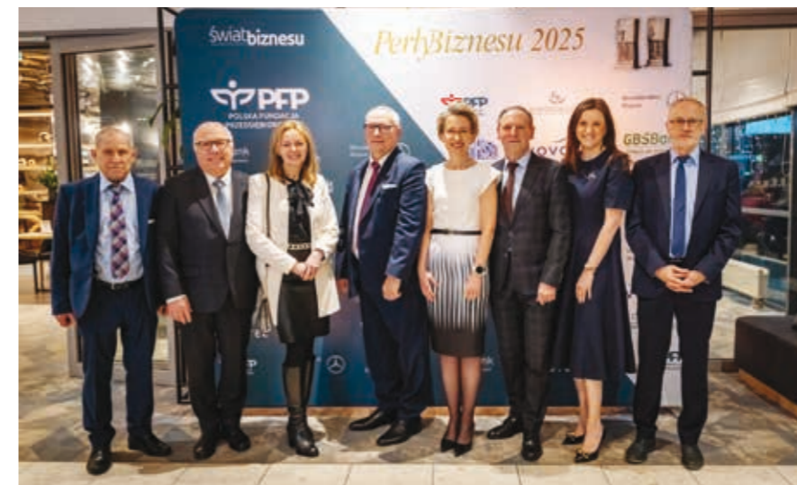
Kapituła Perły Biznesu miała twardy orzech do zgryzienia przy nominacji laureatów ze względu na wysoki poziom zgłoszonych kandydatów.